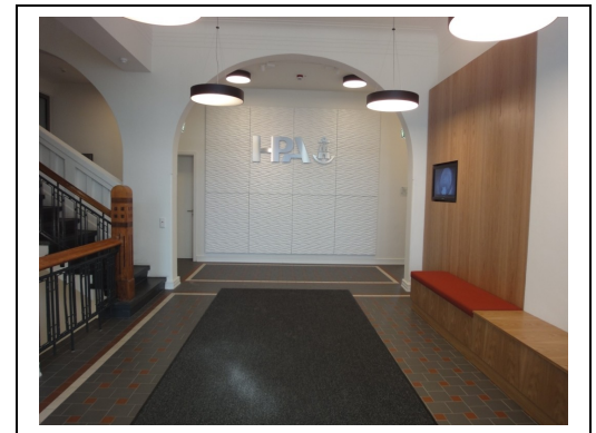
Eingang / Treppenhaus

Während der Realisierung traten zahlreiche Gebäudemängel an der Tragkonstruktion aus der ursprünglichen Herstellphase sowie an der Gebäudehülle infolge Durchfeuchtung auf.