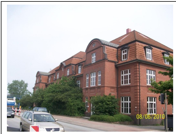
Veddeler Damm 14 vor Baubeginn Sommer 2010

Im Rahmen eines sehr kurzen Planungs- und Realisierungszeitraums ist Contelos Engineering GmbH mit der Projektsteuerung des Gesamtprojektes und mit der technischen Beratung zu allen weiteren infrastrukturellen Fragestellungen im Zusammenhang mit dem Bestand und dem Grundstück Anfang 2010 beauftragt worden.